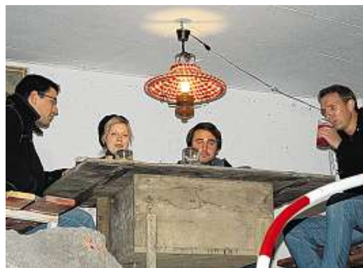
Ein Stückchen Heimat: Die Stube von Eikrann und Stäger wird trotz schwierigem Zugang rege besucht.